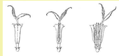
Die Röhrenblüten der Scheibe einer Halskrausen-Dahlie